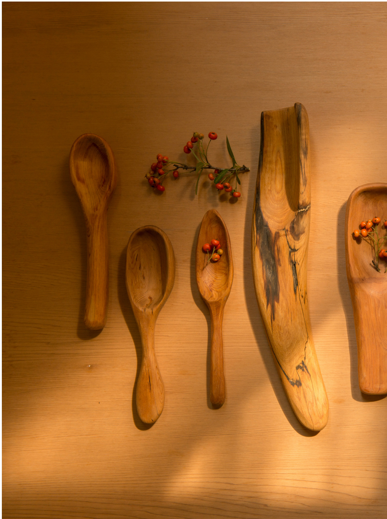
成器非器，從自然中學習線條。苑裡蕉埔 (2018年10月8日)