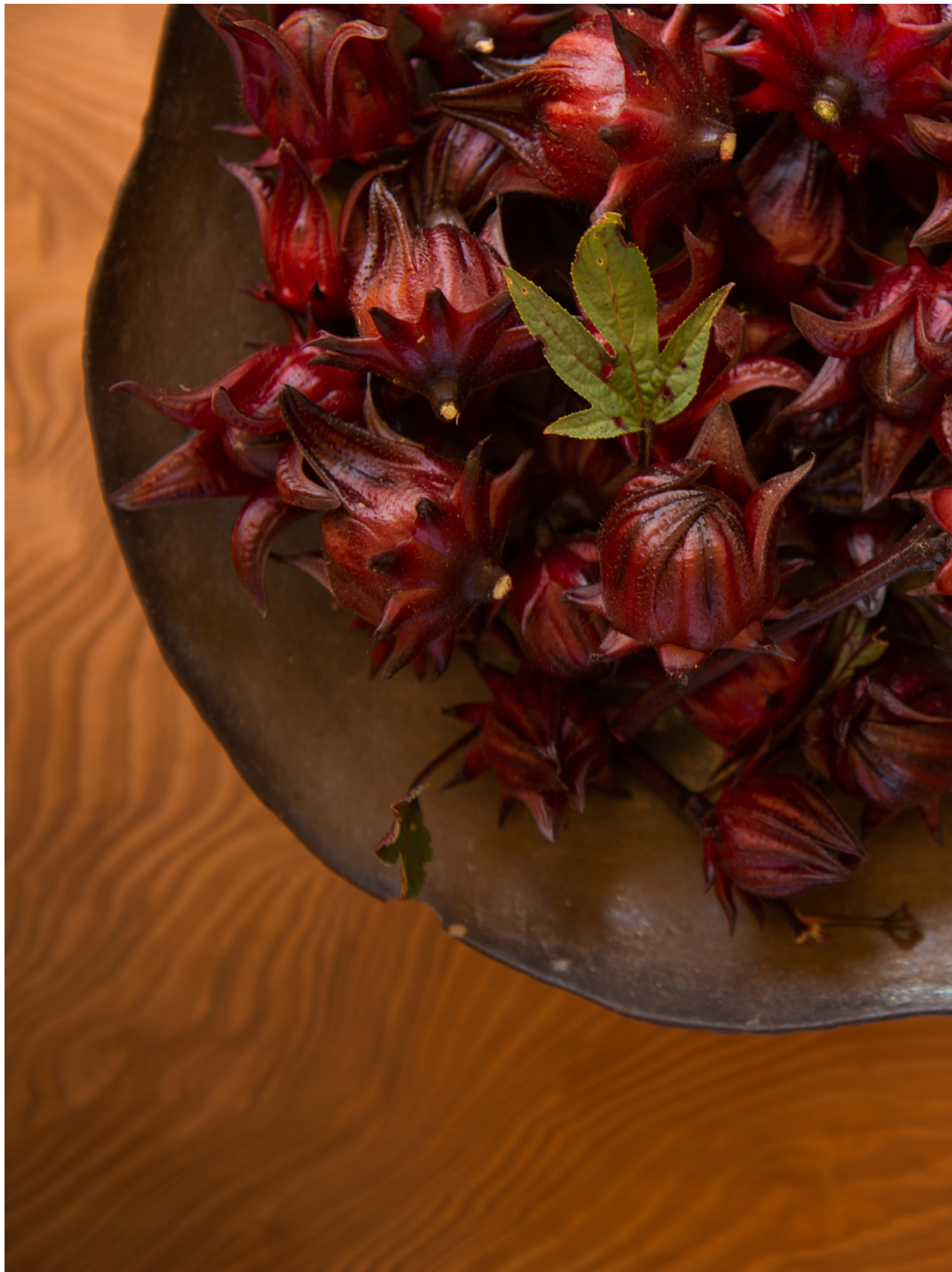
另一種艷紅，在陽光映照下顯現。苗栗三義（2018年11月24日）