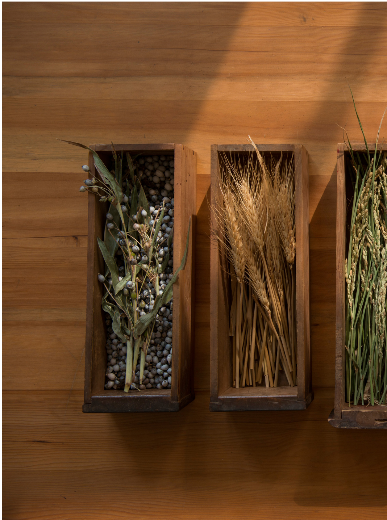
節氣穀盒。台中（2016年11月14日）