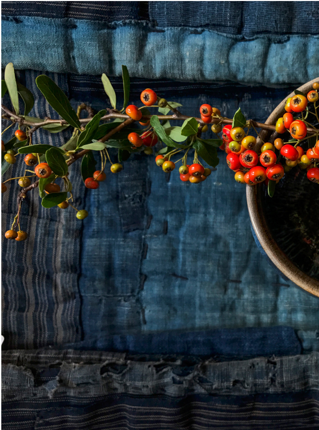
日本襪褸上的狀元紅（2018年11月9日）