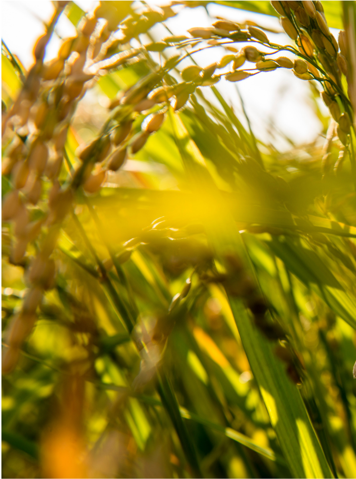
稻穗。苑裡蕉埔（2018年10月27）