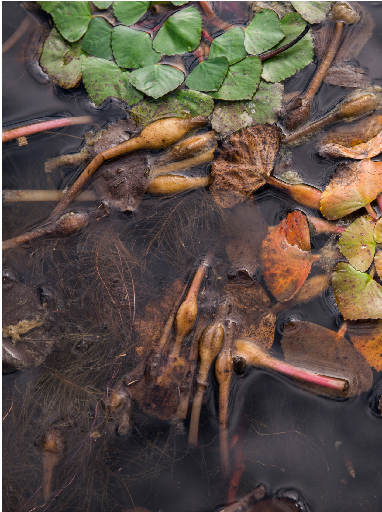
菱角，明年見（2018年11月21日）