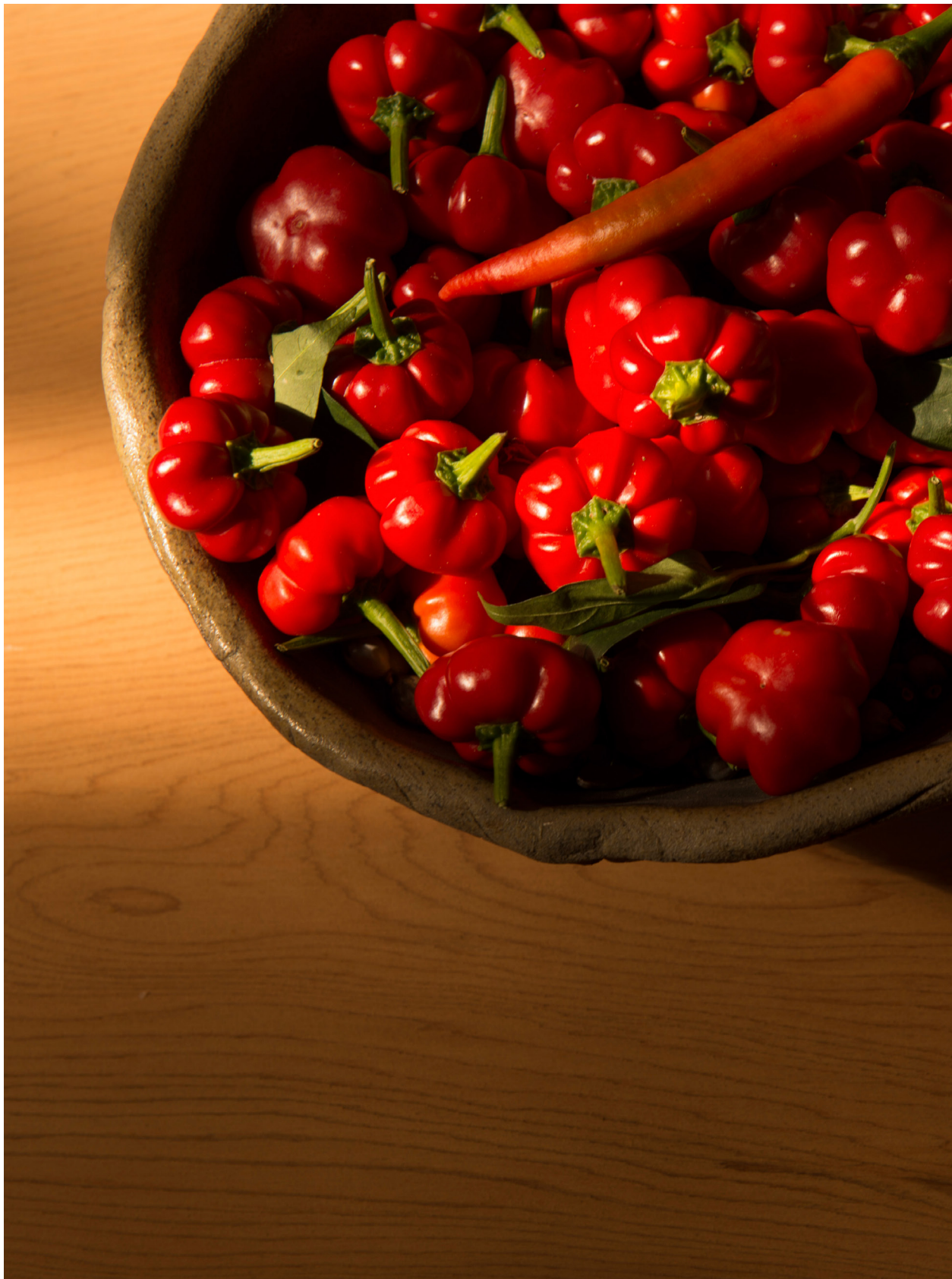
火辣椒紅。苑裡蕉埔（2014年10月4日）