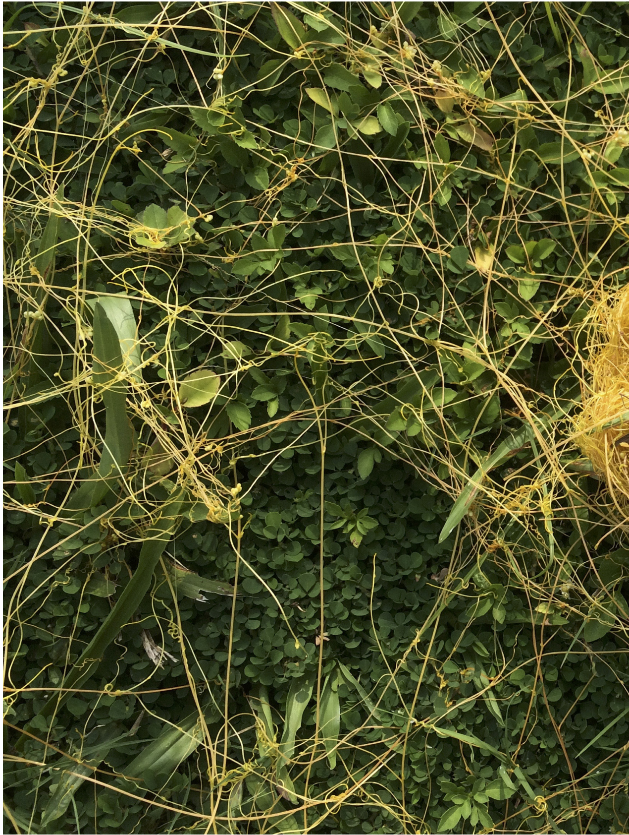
兔絲草，收它成球。苑裡蕉埔（2015年7月29日）