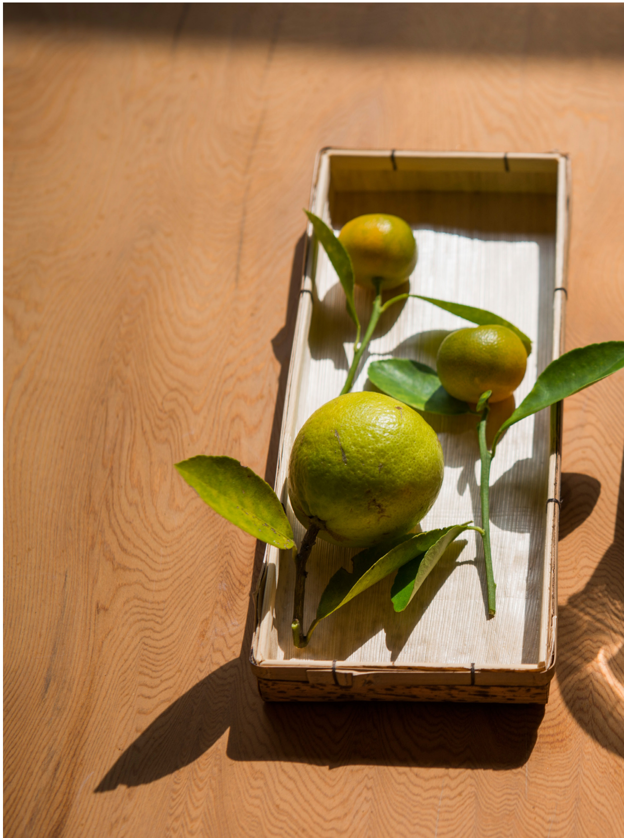
蝶豆花飲。苑裡蕉埔（2018年11月21日）