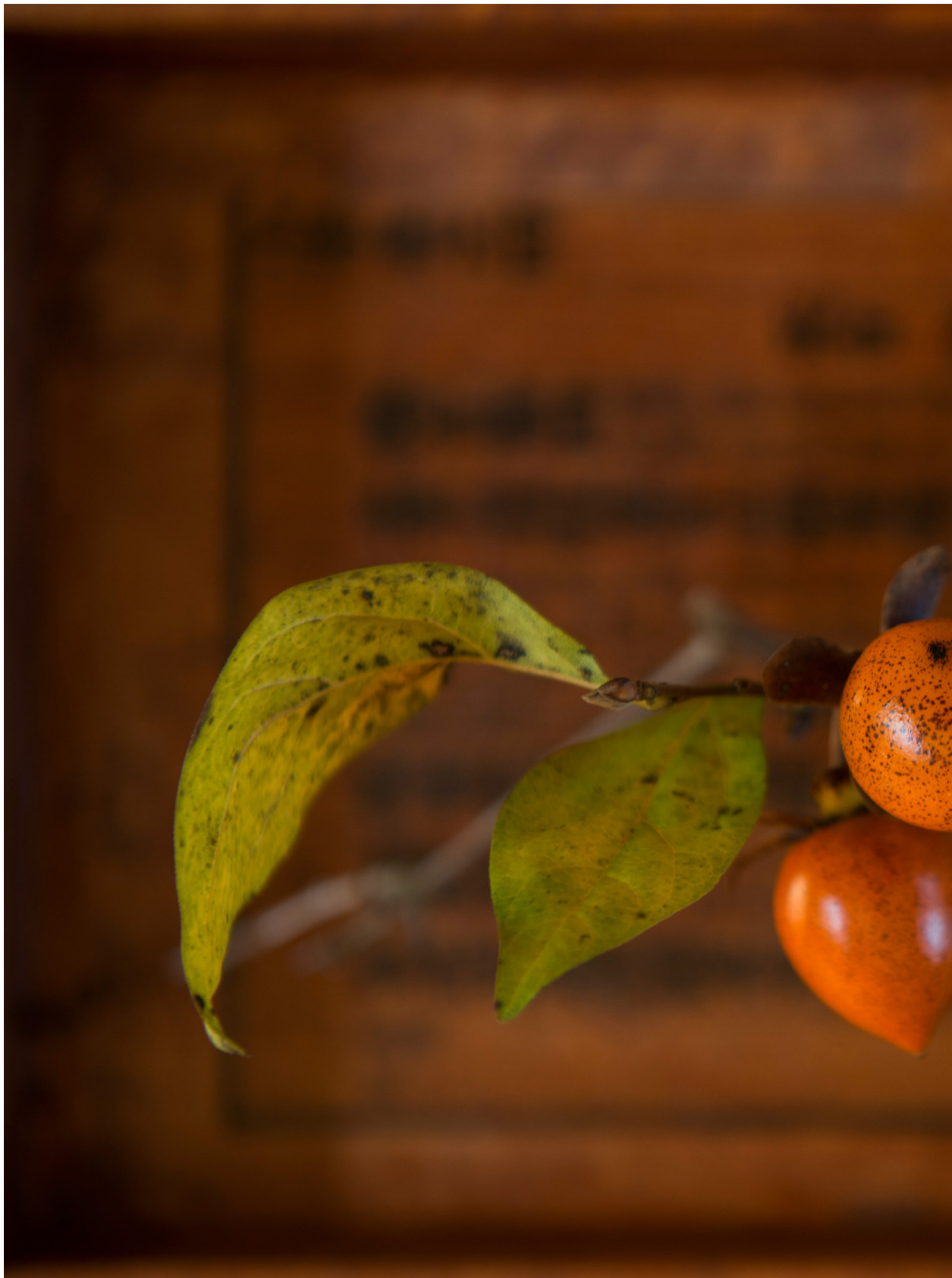
老鴨柿。苑裡蕉埔（2018年11月24日）