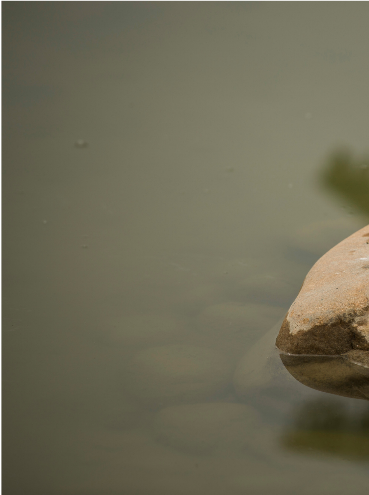
翠鳥棲石。苗栗苑裡蕉埔（2014年11月8日）