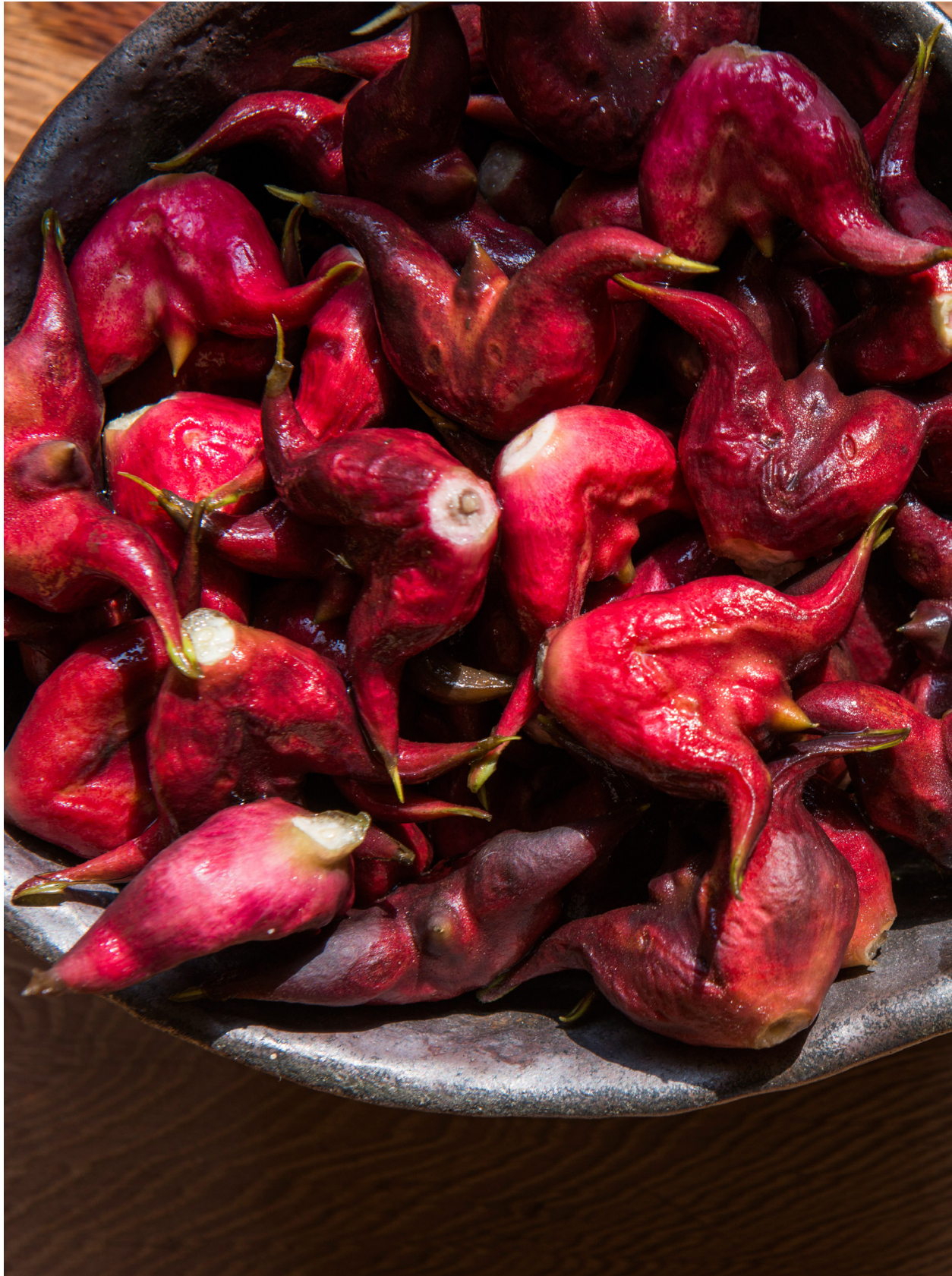
最後一批的菱角與黃葉（2018年11月21日）