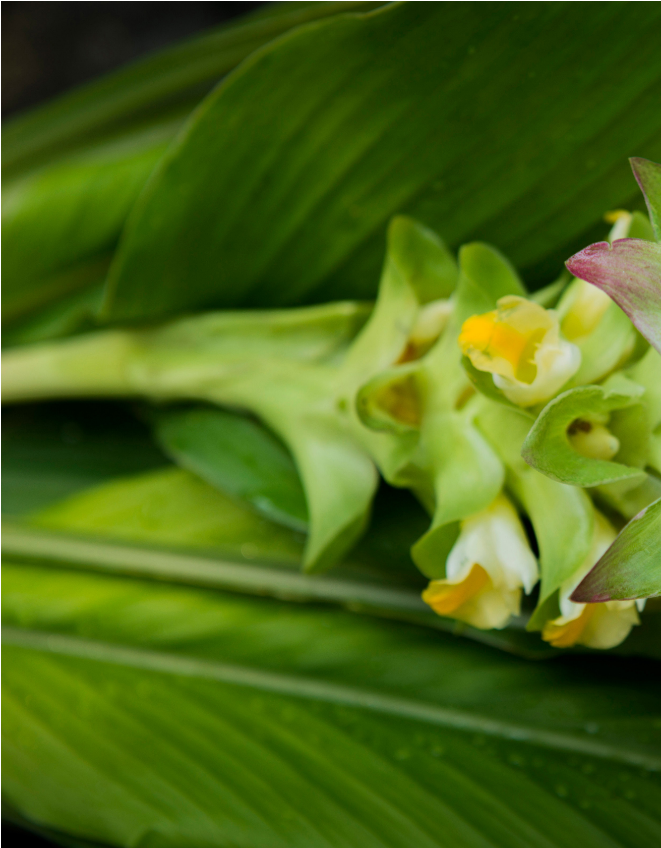
大雨，薑黃花開得狼狽。苑裡蕉埔（2019年8月17日）