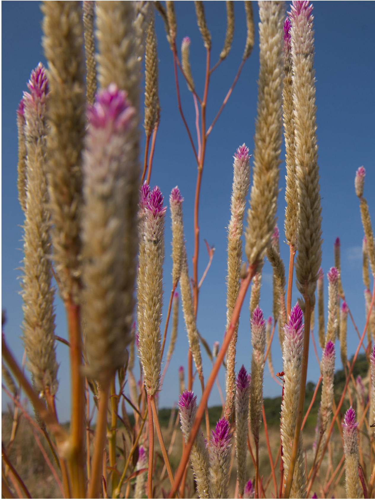
青葙，東北季風後。台中大安溪（2019年12月11日）