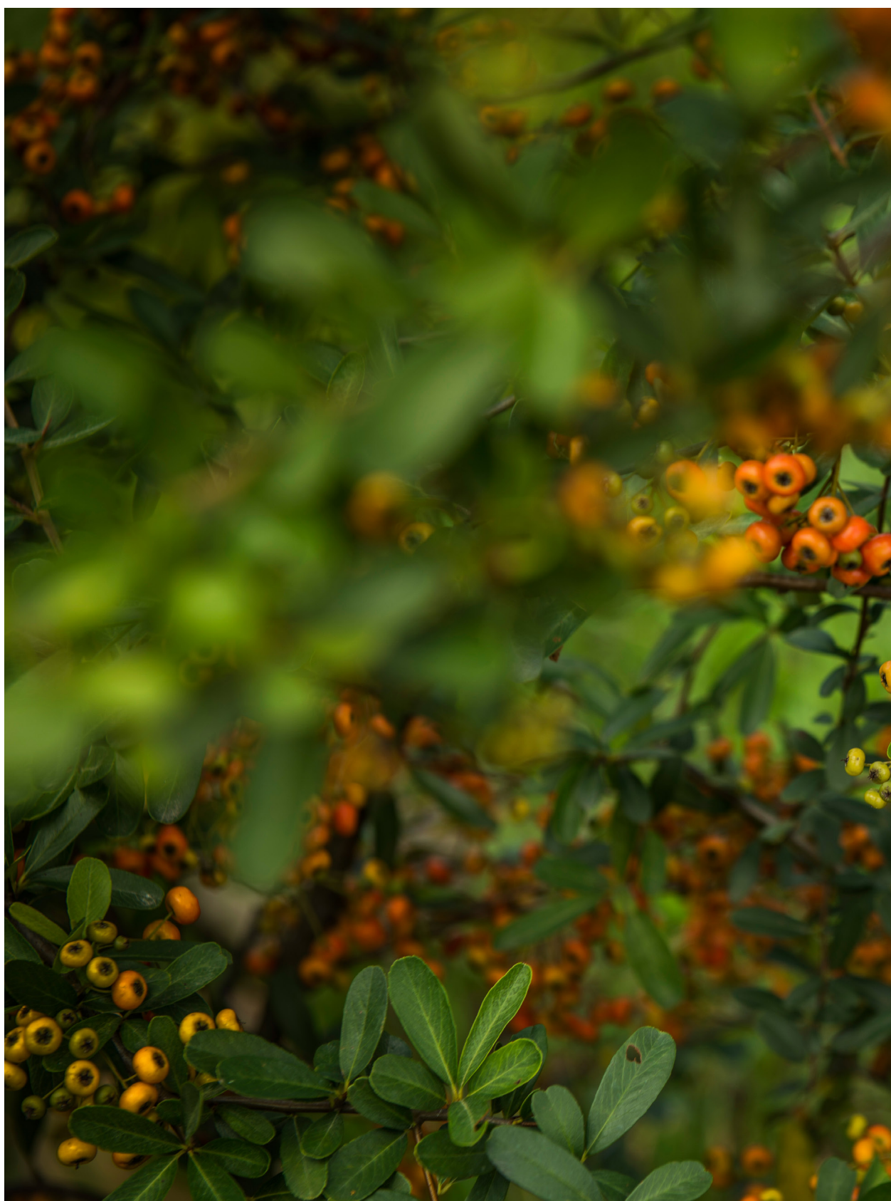
轉色中狀元紅。苑裡蕉埔（2013年09月24日）