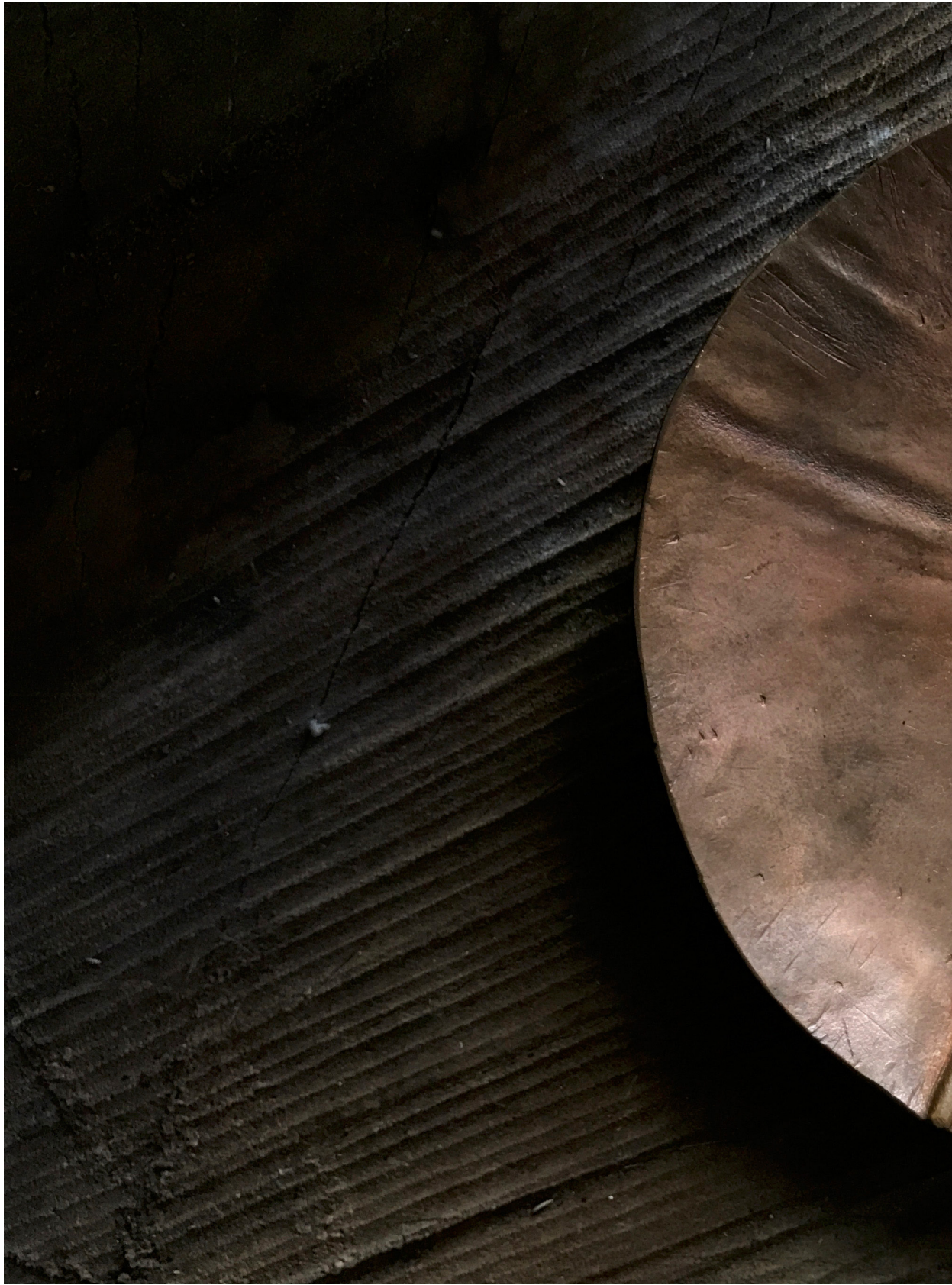
銅盤上的月桃果實。台中東海（2017年10月9日）