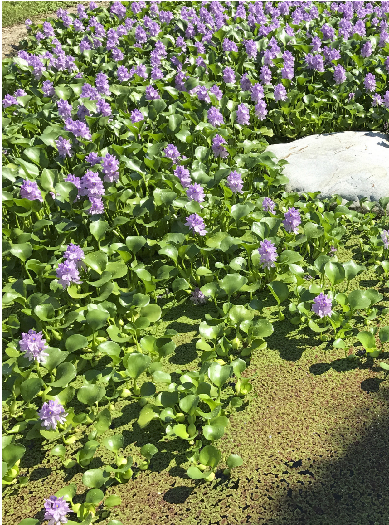
布袋蓮花開，賞花看緣分。苑裡蕉埔（2017年07月12）