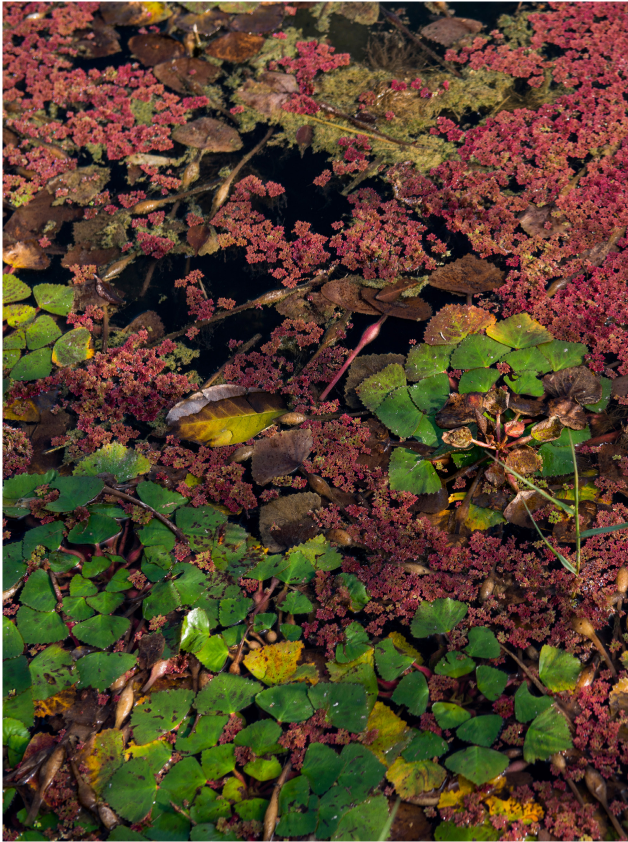
是冬，是春？是台灣啦！苑裡蕉埔（2018年11月30日）