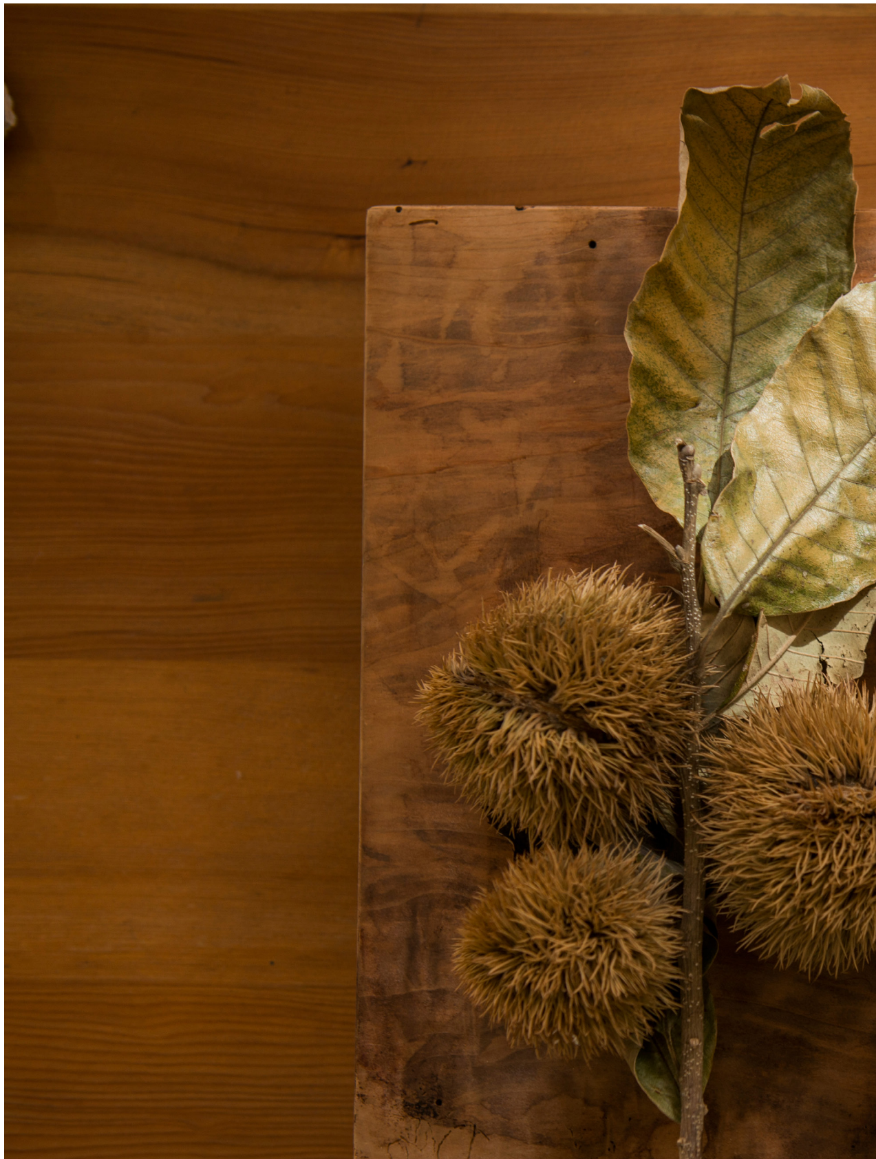
栗子。新北市（2016年11月13日）