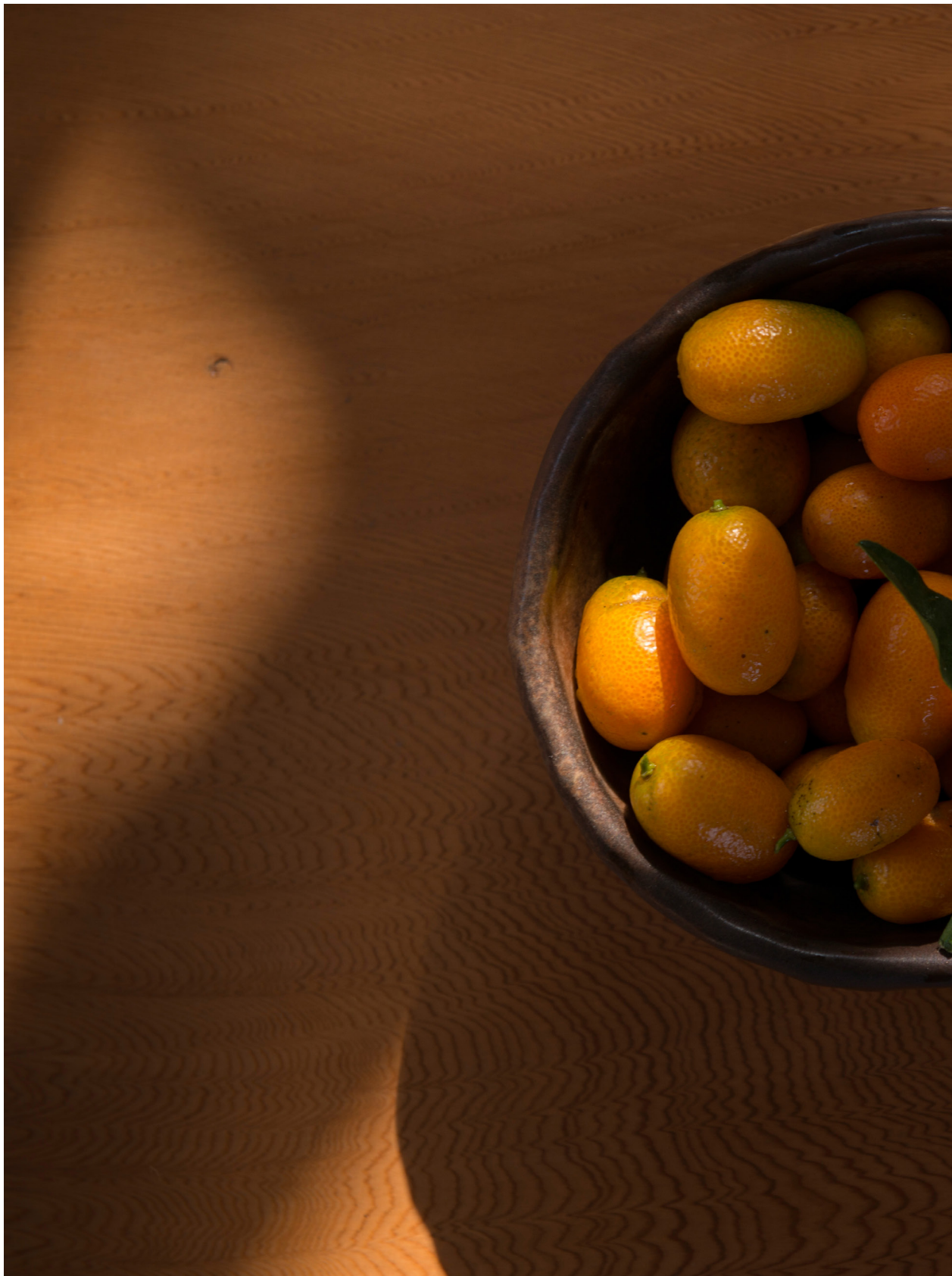
金棗，挺美的。苑裡蕉埔（2018年12月15日）