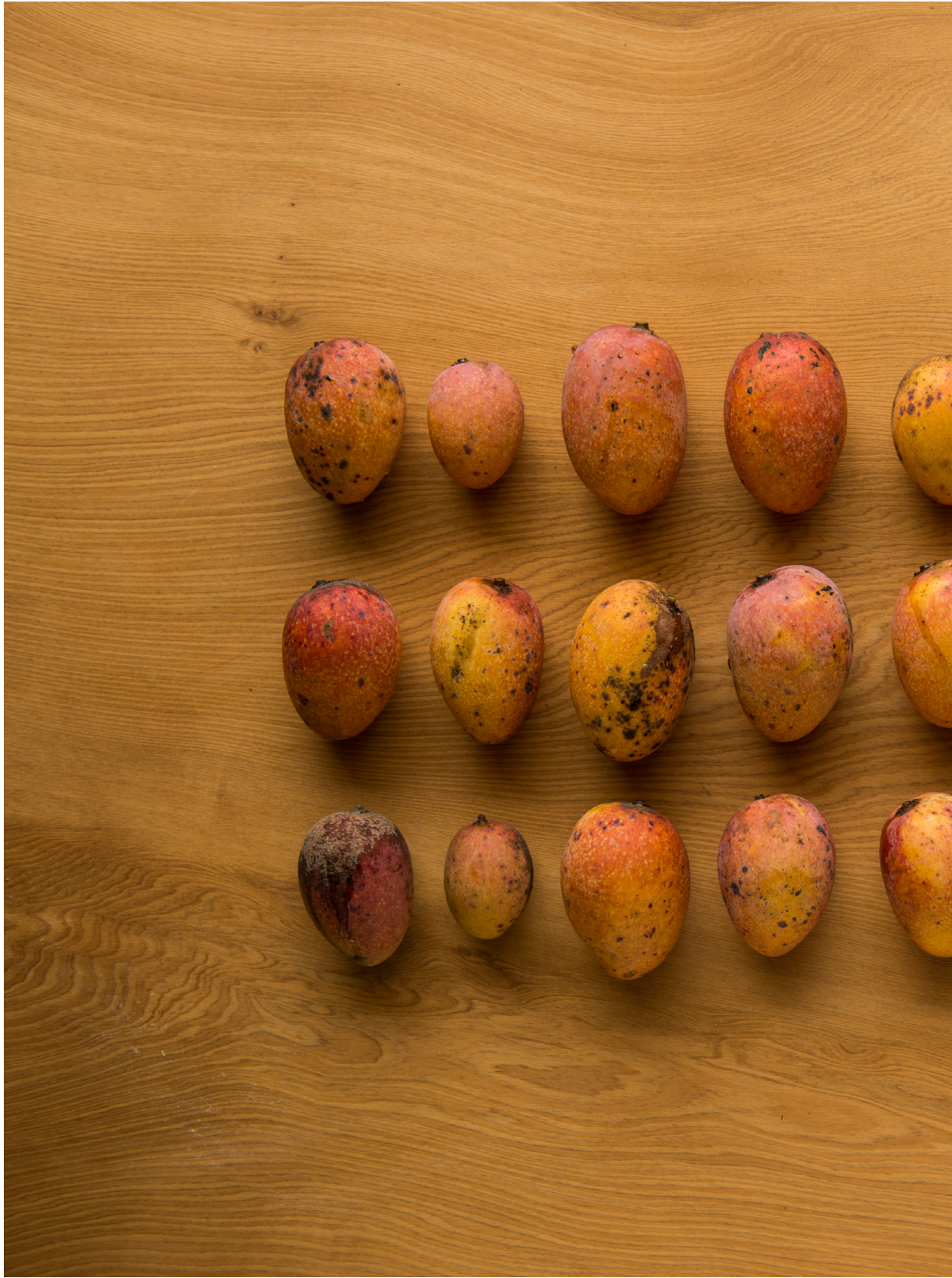
樣子有點醜，但色彩豐富的芒果。苑裡蕉埔（2014年7月14日）