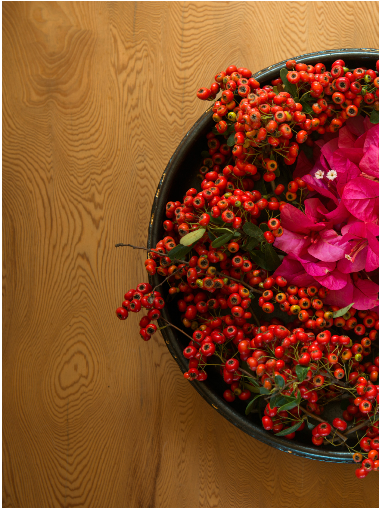
狀元紅與九重葛花 (2018年11月9日)