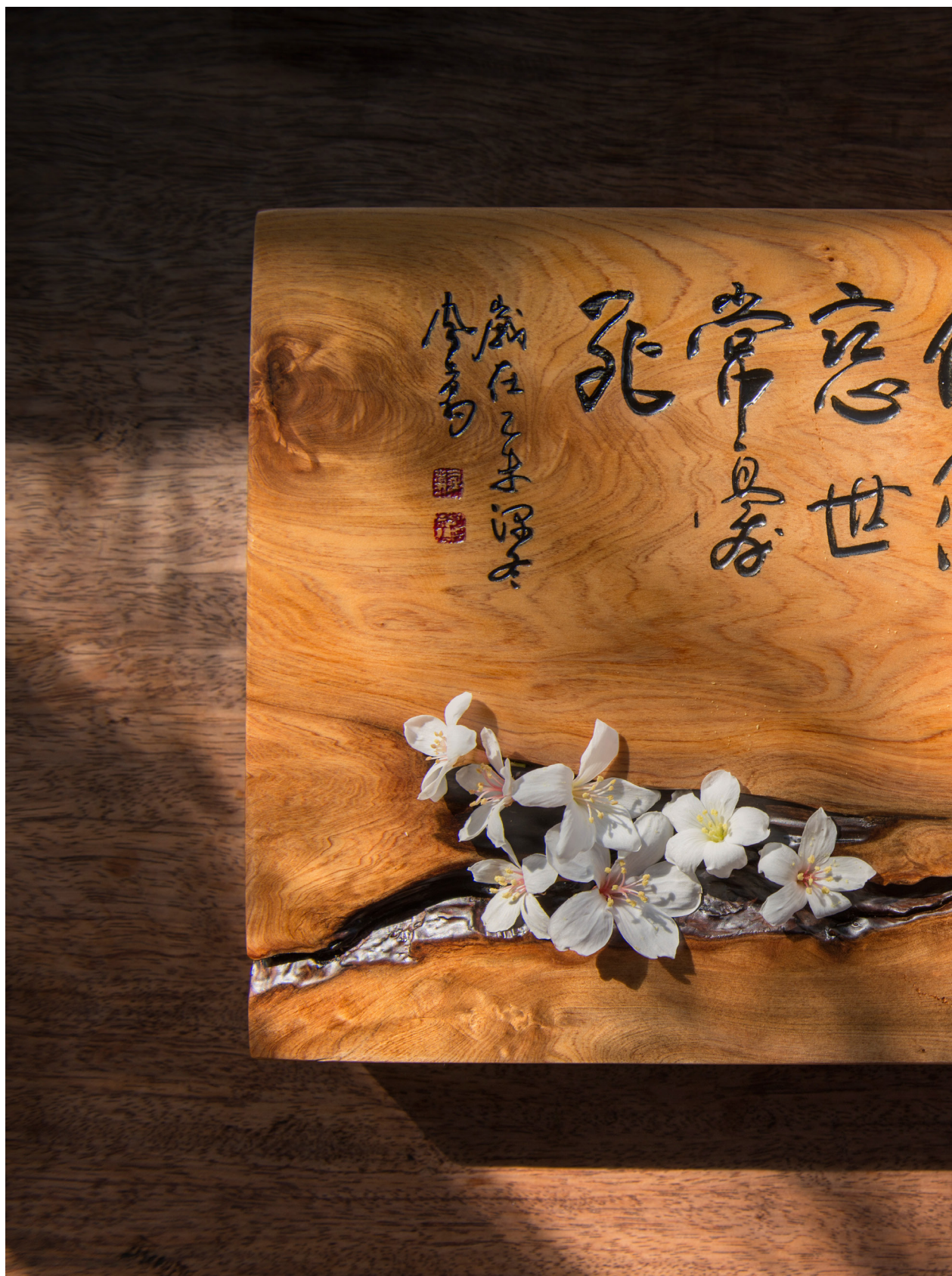
冬之油桐花開。苗栗三義 (2016年11月25日)