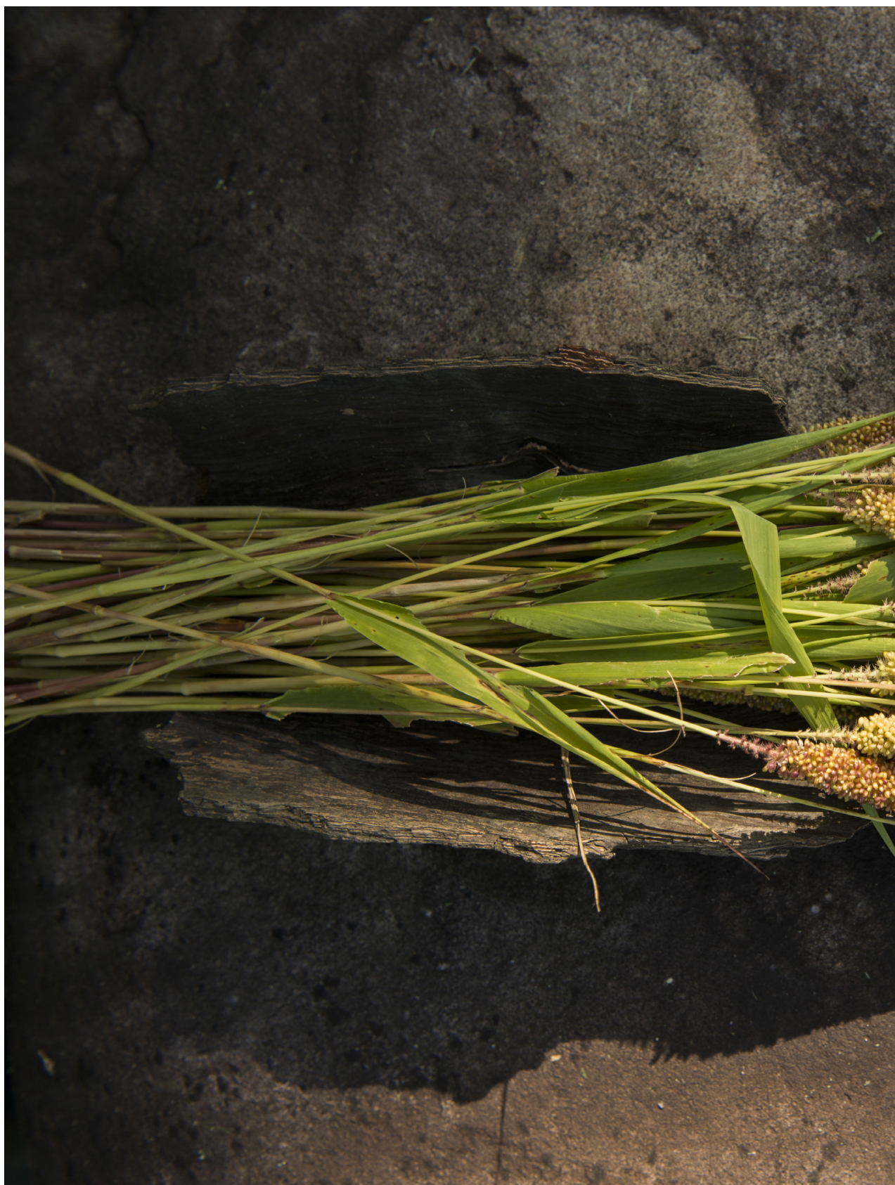
名為百花，實為千朵之水芹菜。苑裡蕉埔（2019年6月15日）