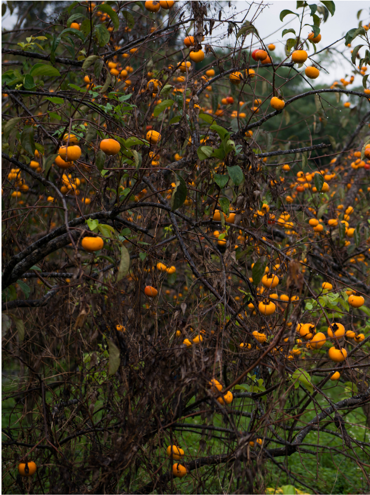
雨中的柿子樹。新竹北埔（2018年11月23日）