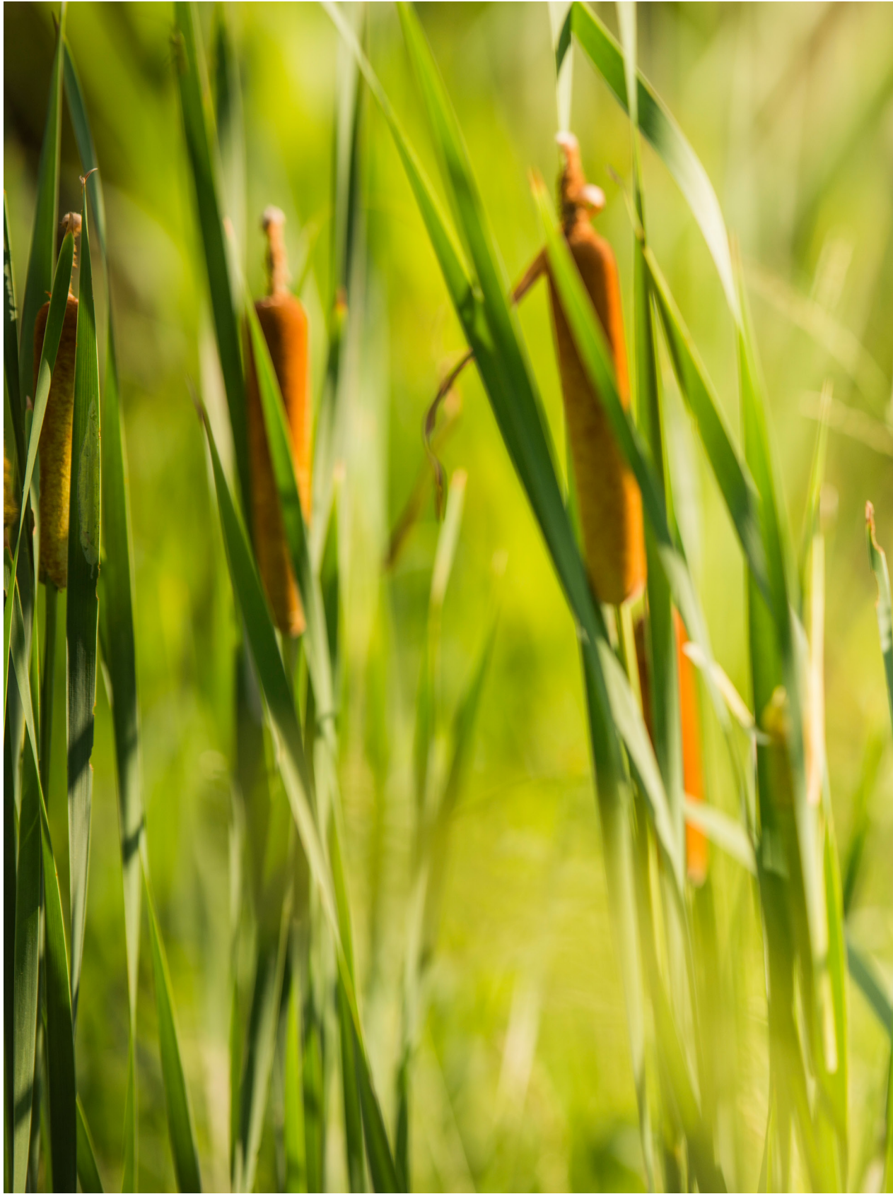
木翠鳥與水蠟燭，老詹作品。苑裡蕉埔（2019年07月25日）