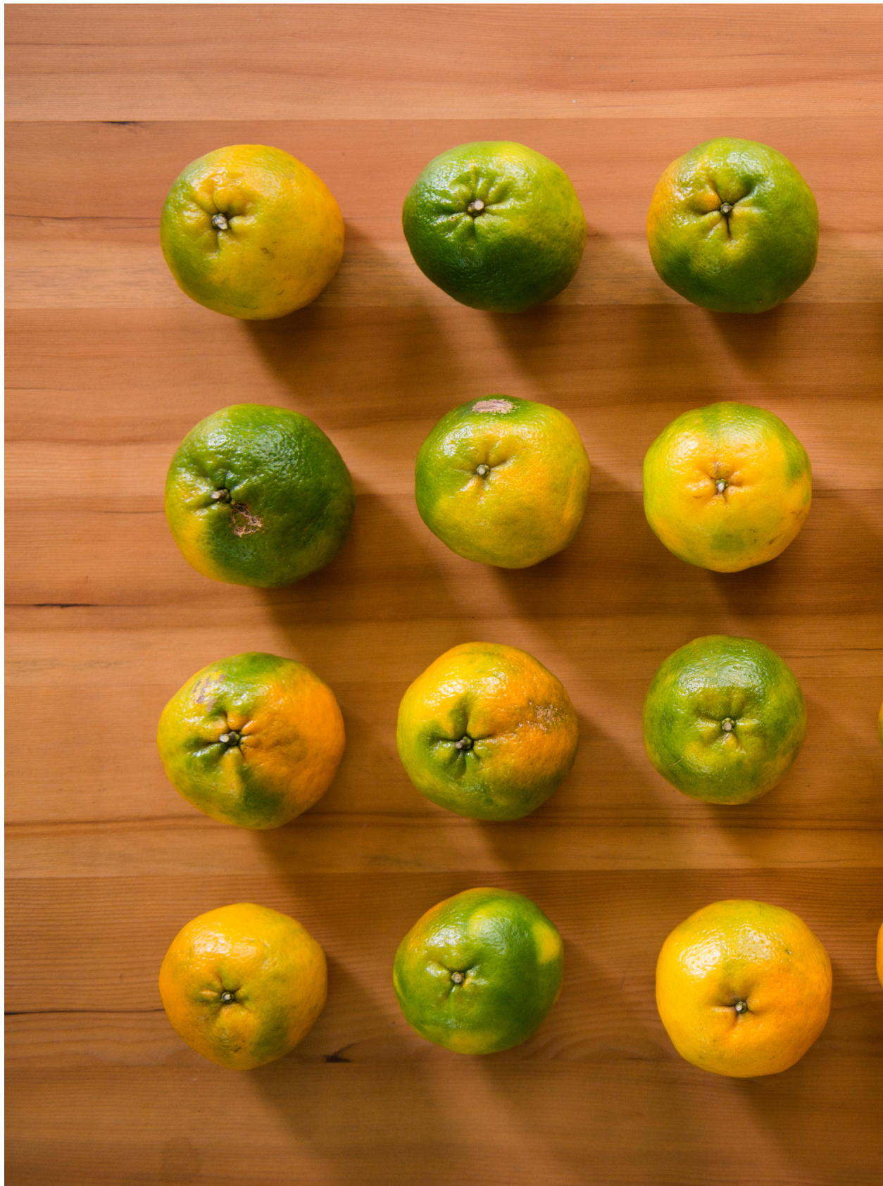
看起來一樣，但都不一樣的橘子。台中石岡（2017年11月29日）