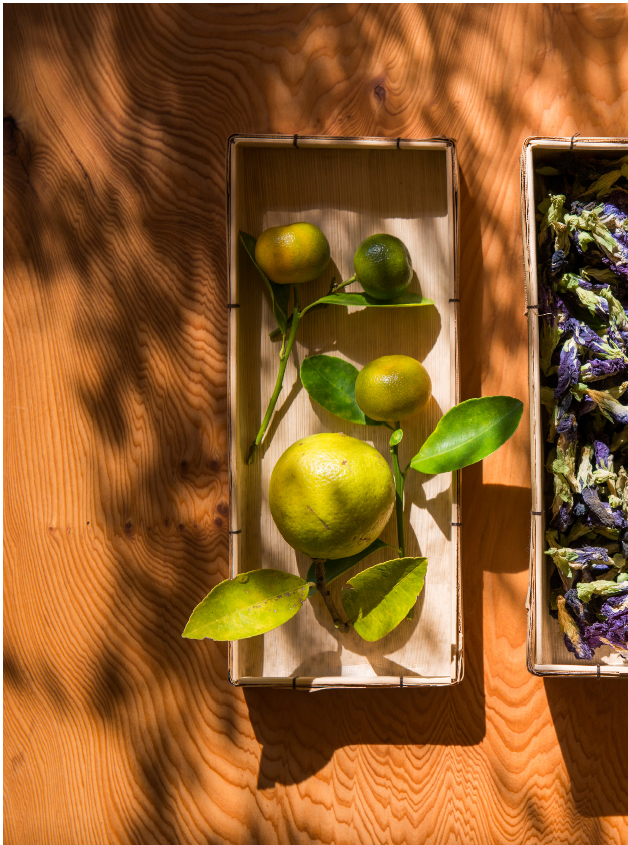
蝶豆花。苑裡蕉埔（2018年11月21日）