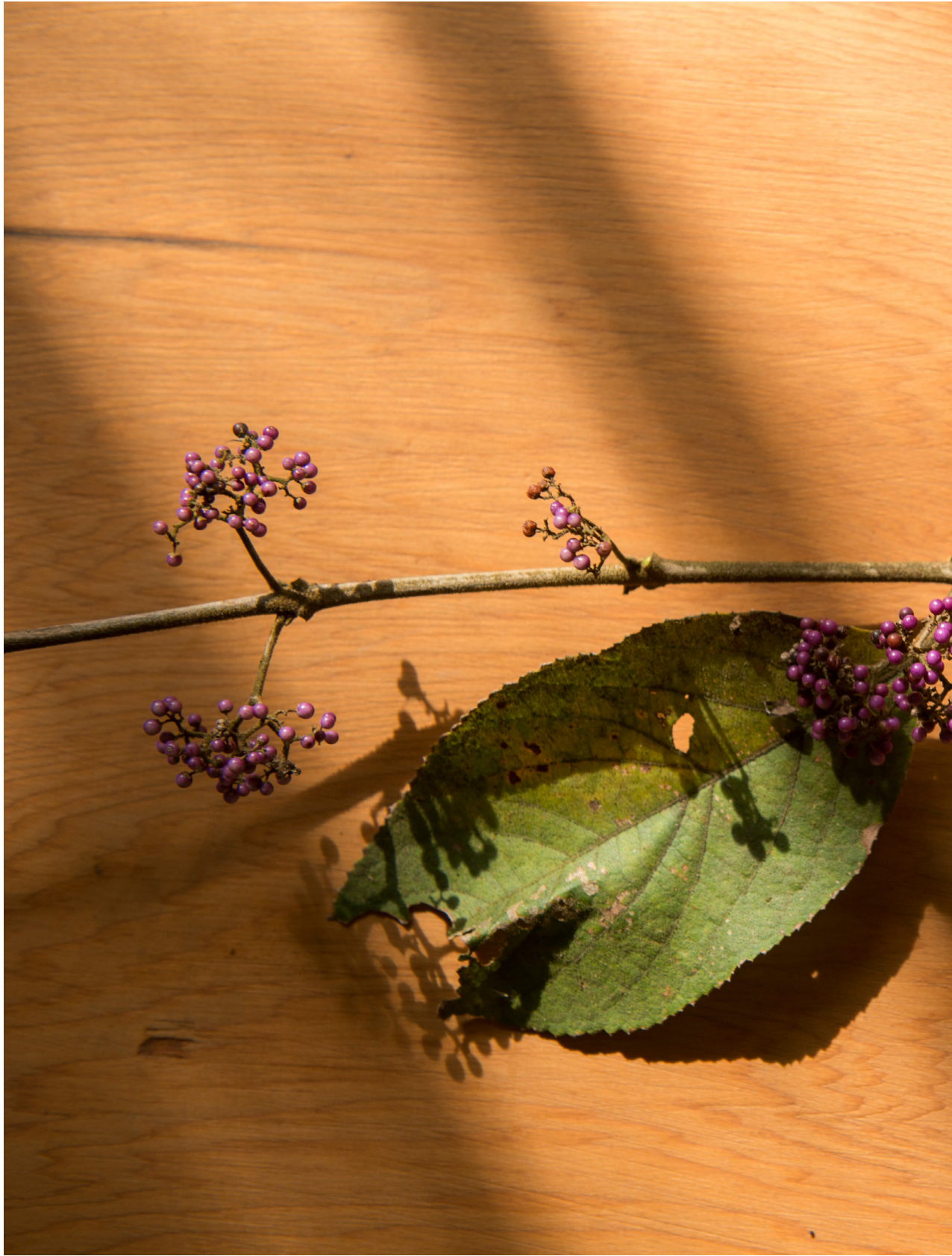
紫珠。苗栗三義 (2017年11月13日)