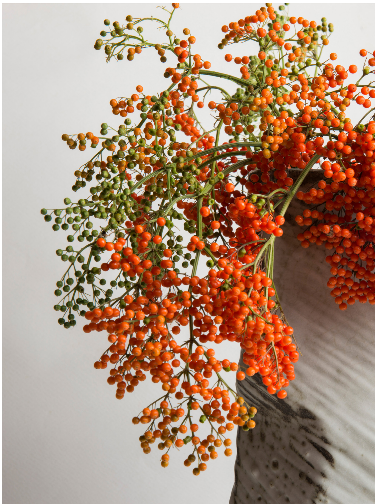
有骨消之實，苗栗三義（2016年7月9日）