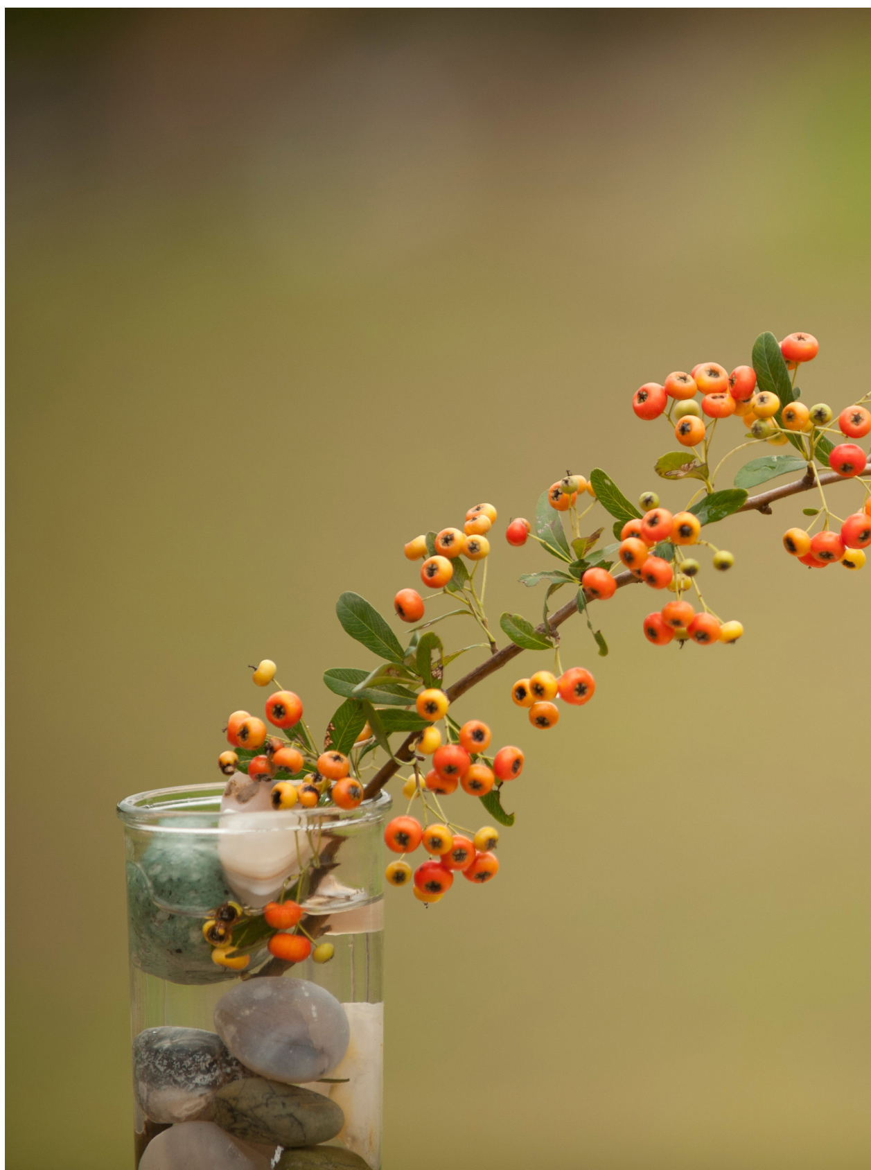
狀元乍紅。苑裡蕉埔。（2011年10月13日）