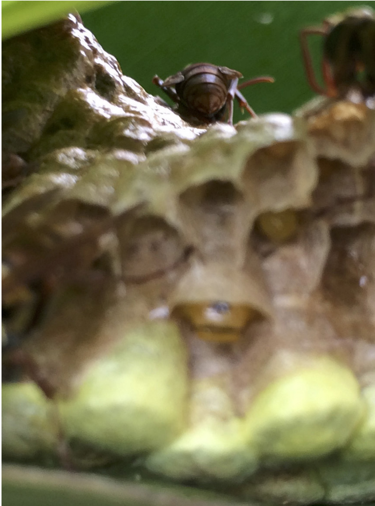
胡蜂相對。苑裡蕉埔（2016年7月2日）