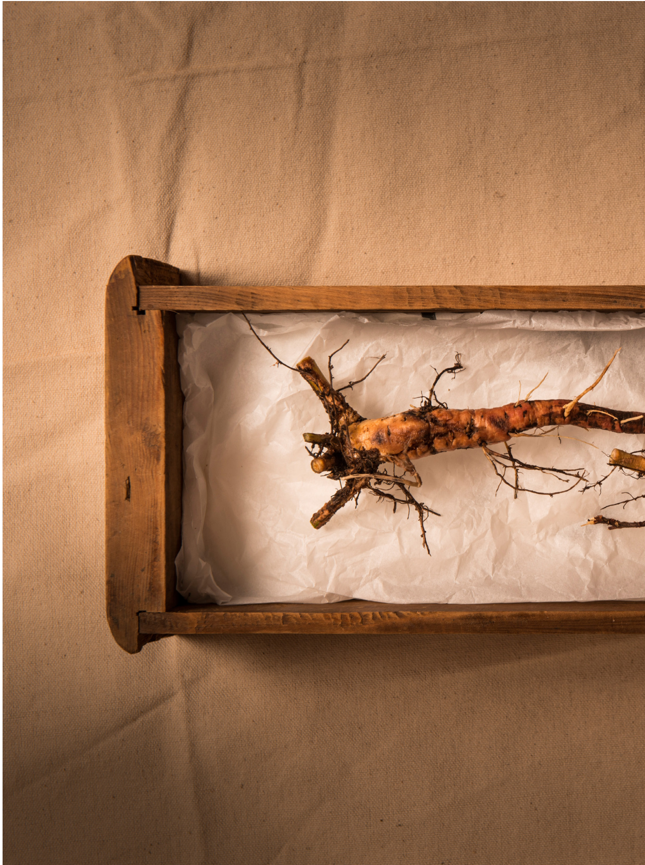
如果是人蔘就好了，含羞草根。苑裡蕉埔（2014年10月7日）