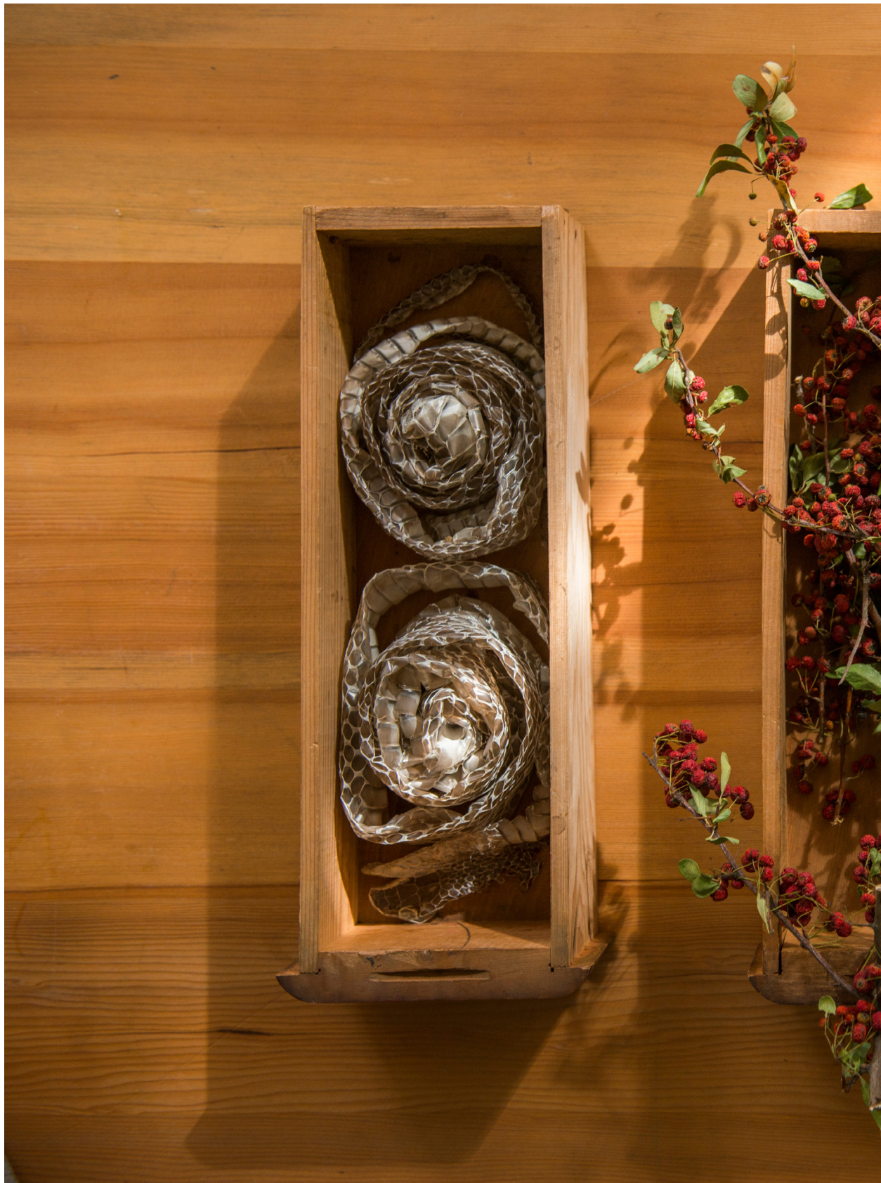
蛇褪，也是一種自然。苑裡蕉埔（2017年11月13日）