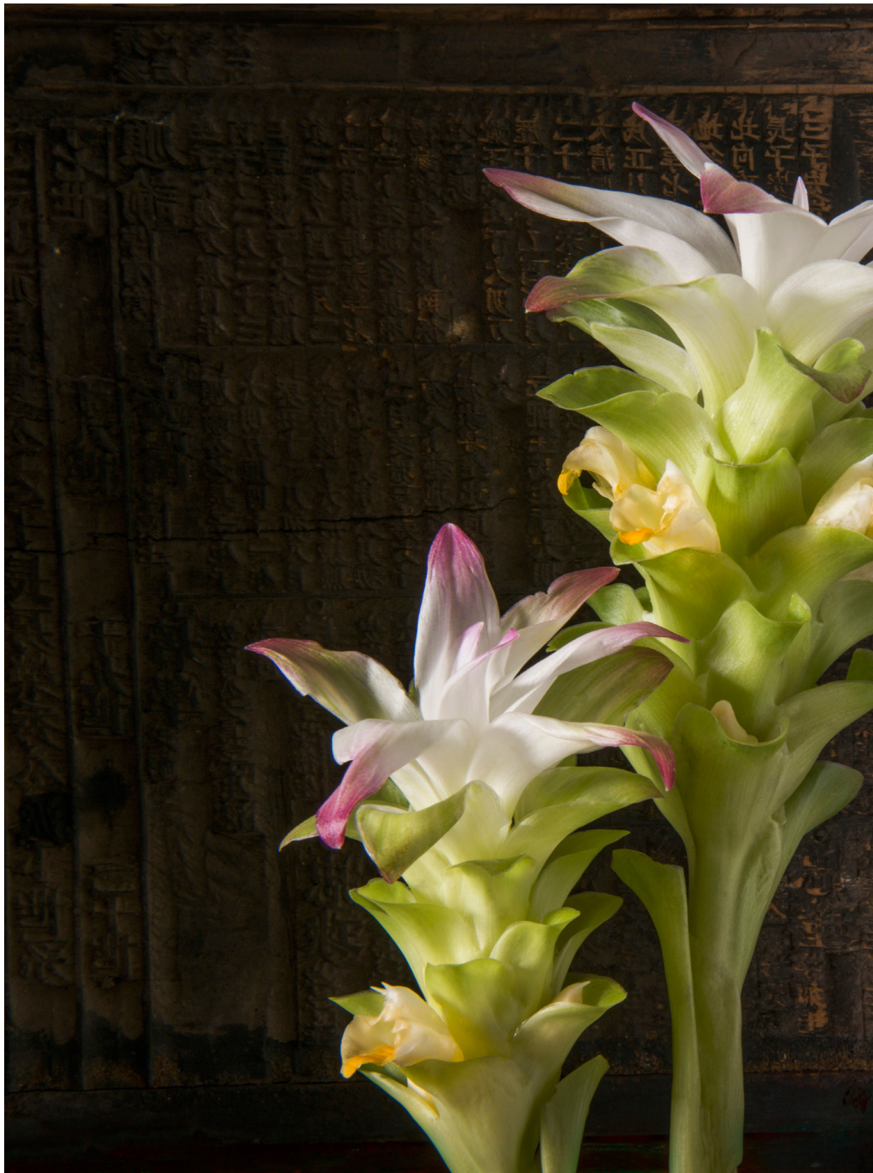
老木印版前薑黃花。苑裡蕉埔（2019年8月17日）