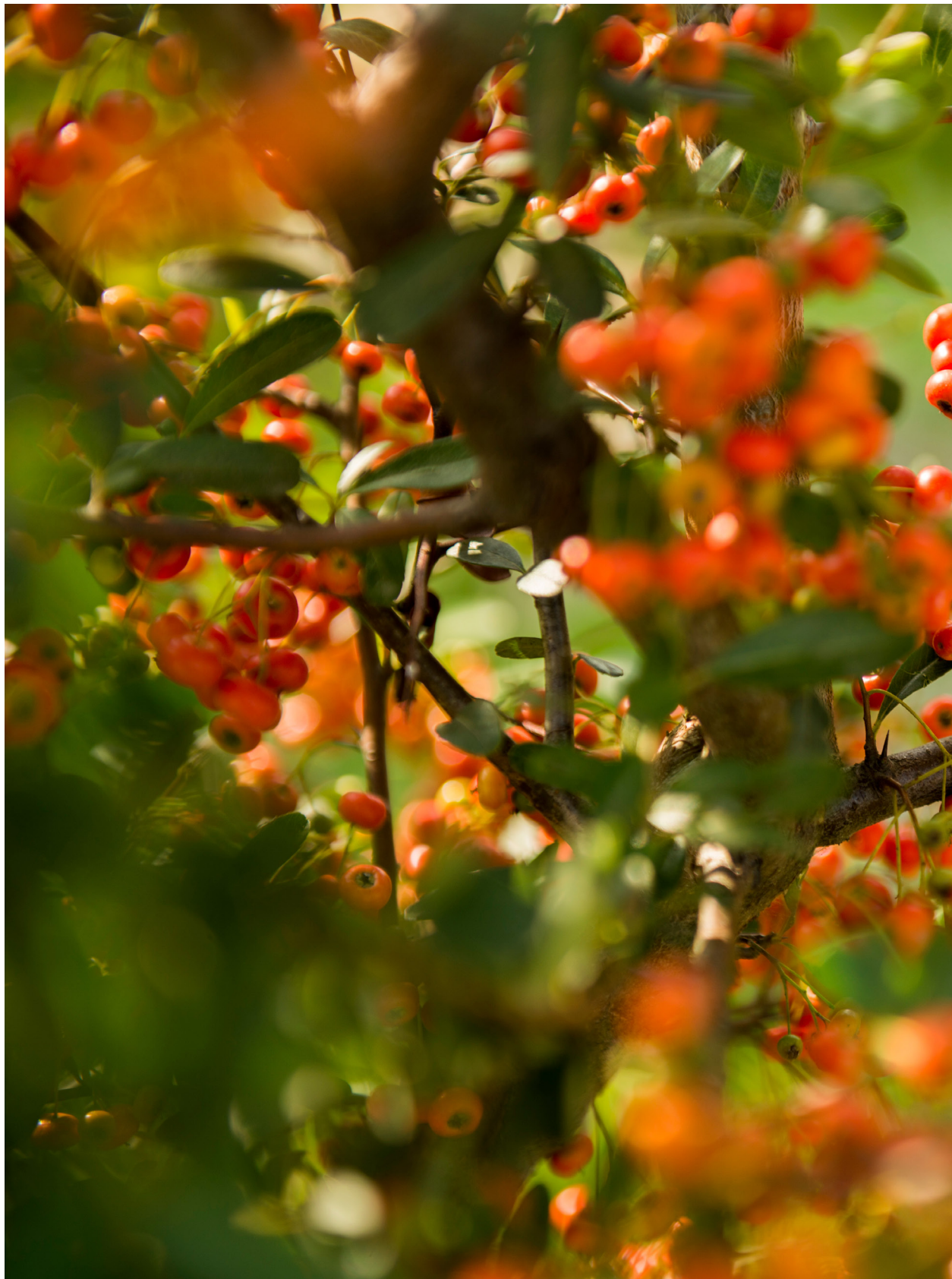
東北季風狂掃，狀元紅更深 2013年10月3日